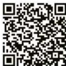
Lista kontrolna (wersja cyfrowa w j. angielskim)

Polską wersję językową Podręcznika oraz Listy kontrolnej znajdziesz na: www.interakcja.org.pl/podrecznik/